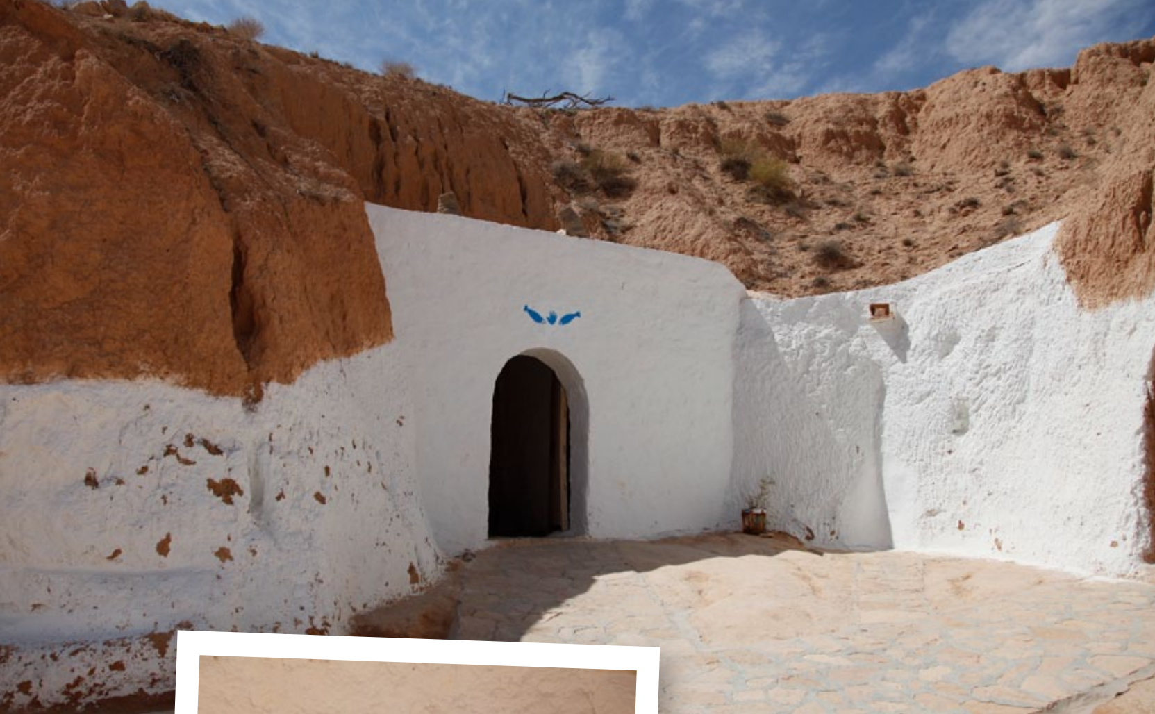
Ingången till en ännu bebodd berbergrotta.