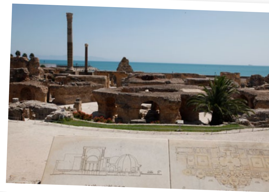
Det romerska spaet i Kartago. På teckningen i förgrunden ser du hur det en gång såg ut.

Efter en sen lunch kom vi lagom till vår bokade tid på Yasmine Hammamet Hammam. Detta spa är något utöver det vanliga. Vi var efteråt både helt avslappnade men på samma gång eld och lågor över upplevelsen! Vi pratar om det än, det var en helt unik upplevelse.