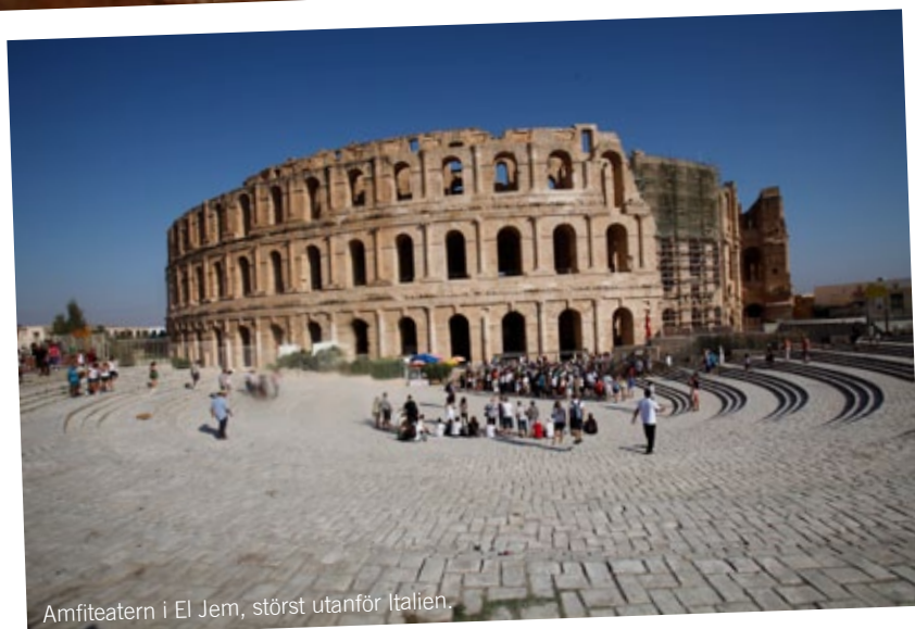
Amfiteatern i El Jem, störst utanför Italien.

Tunisien är ett land som fyller på ditt förråd av upplevelser att berätta om. Miljöerna, människorna och alla sevärdheter gör resan till något du aldrig glömmer och som du gärna delar med dig av när du kommer hem. Men kanske kan du inte hålla dig och vill berätta redan medan du är där. | Redigering av vykortstext: Magnus Teander