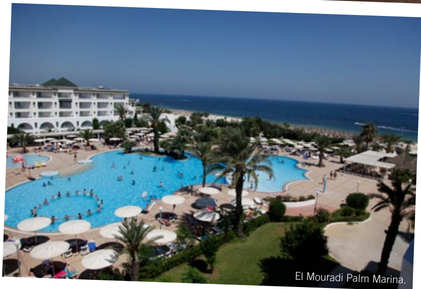
El Mouradi Palm Marina.